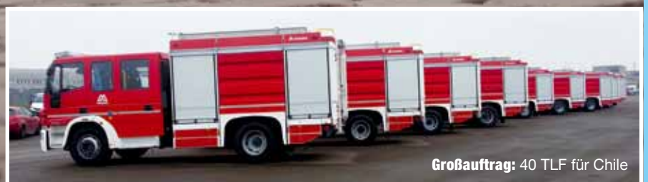
Großauftrag: 40 TLF für Chile