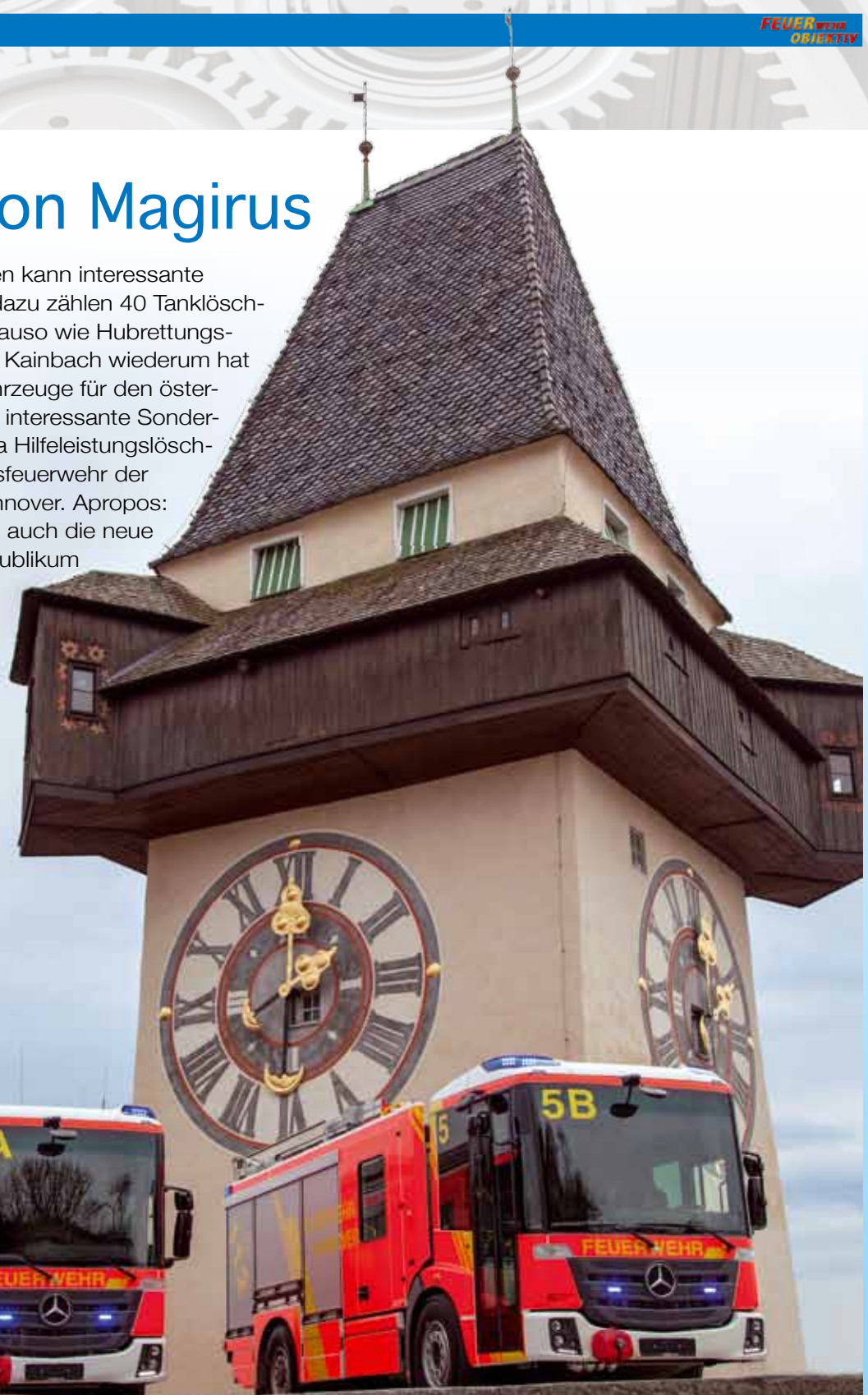
Zwei neue Hannoveraner: Zwei HLF wurden kürzlich ausgeliefert.